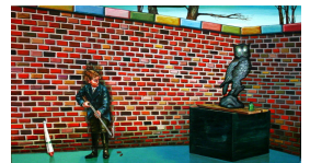
Olle Schmidt: Backyard owl. 2009. Olja, 100x200 cm.