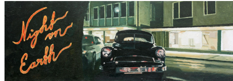
Björn Svensk: Night on Earth. 2008. Olja, 20x50 cm.