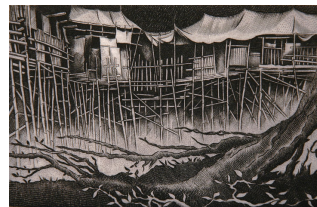
Åke Johansson: Längs floden II. 2006. Kopparstick, 8x12 cm.