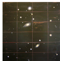
Karin Ögren: Andromeda. 2009. Olja, 70x70 cm.