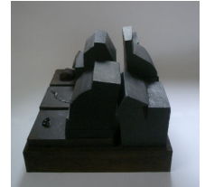
Bo Arnros: Efter festen I. 2009. Blandteknik, 40x32x26 cm.