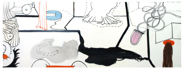
Monica Höll: From one room to another. 2009. Olja, 77x203 cm.