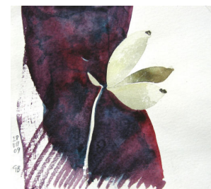
Gösta Backlund: DagboksBild 28 juli 2009. Akvarell, 12x14 cm.