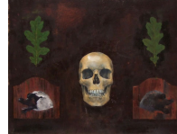
Claes Fahlgren: Local hero. 2009. Olja, 22x30 cm.