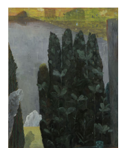
Michael Söderlundh: Mellan hitom och bortom. 2007. Olja, 115x90 cm.